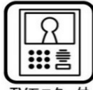
TVモニター付 インターホン